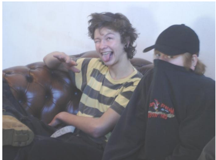
Repræsentanter for en af banderne

Det ender galt, hvis vi ikke handler lokalt. Rust dig – angiv en rocker – byg fængsler i Grønland – opgiv blødsødenheden – GØR DANMARK FRI FOR BANDER!